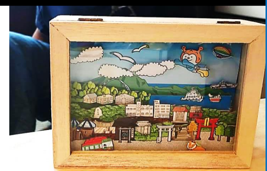
ほのほのとした気仙沼のキット