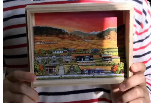
里山八瀬のキット